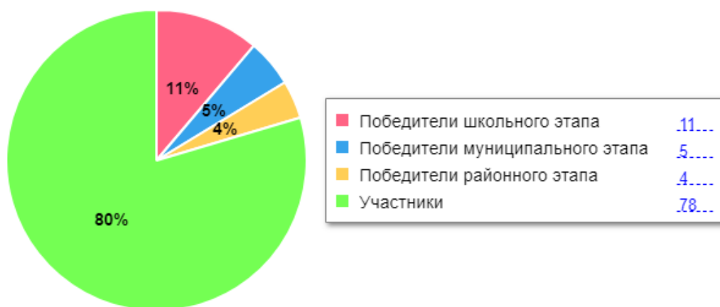
Таблица 21. Востребованность выпускников